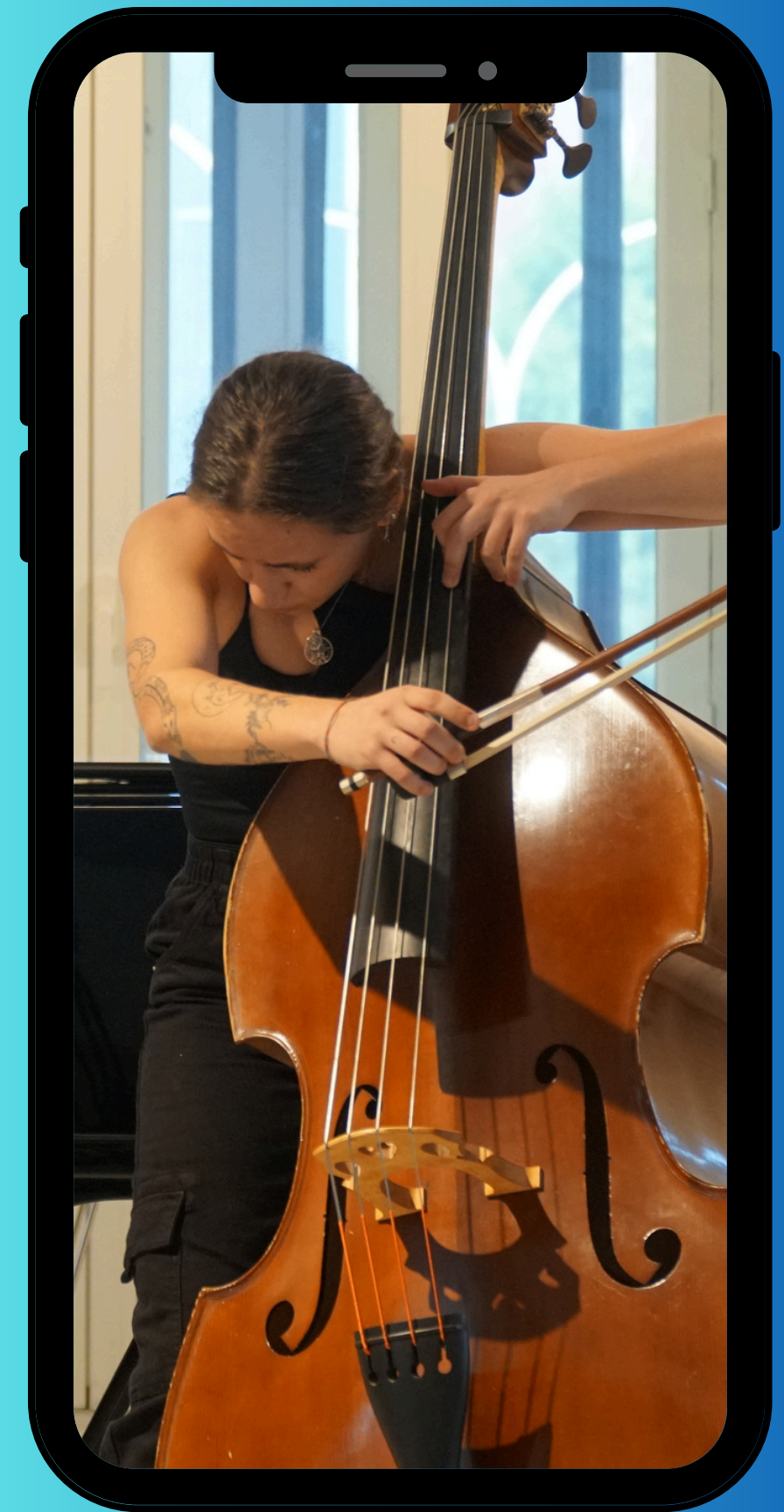
Centro Superior KATARINA GURSKA